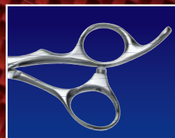
MCR (マイスタータイプ)