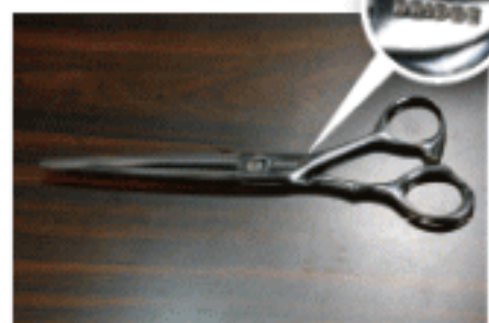
これが『ブリッジ』オリジナルシザーズ。 サロン名も刻印されている。

3月14日生まれ、広島県出身、 広島理容美容専門学校卒業。 『アーティストサロン』『ブリッジ』代表。